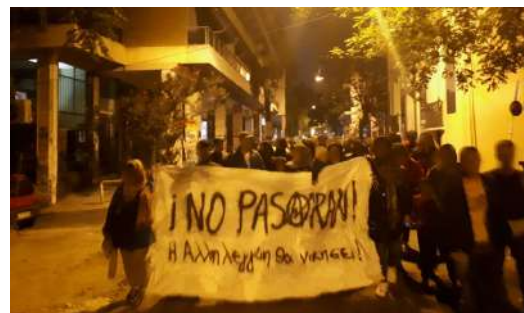
από την πορεία γειτονιάς που κάλεσε η συνέλευση No Pasaran στις 6 Νοέμβρη 2019 σε αλληλεγγύη με την κατάληψη στέγης προσφύγων και μεταναστών Νοταρά 26