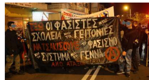
8 Νοέμβρη '19: από την πορεία που πραγματοποιήθηκε στη Θεσσαλονίκη μετά την φασιστική επίθεση σε 14χρονο μαθητή από το Ιράν