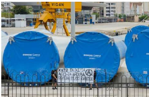
Στο λιμάνι της Πάτρας όπου φυλάσσονται τα τμήματα των ανεμογεννητριών που πρόκειται να τοποθετηθούν στις βουνοκορφές. Ανάρτηση πανό για την πορεία στην Καρδίτσα στις 12/10.