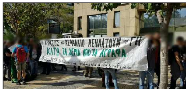
από τη συγκέντρωση έξω από το υπουργείο περιβάλλοντος στην Αθήνα, στις 7 Νοέμβρη 2019