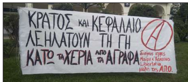
κοινό πανό της αναρχικής ομάδας δυσήνιος ίππος, της συλλογικότητας Μαύρο και Κόκκινο και της κατάληψης Libertatia στην πορεία στην Καρδίτσα στις 12 Οκτώβρη

αναρχική ομάδα «δυσήνιος ίππος» – μέλος της ΑΠΟ