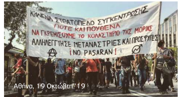
Αθήνα, 19 Οκτώβρη '19

Η κατάσταση αυτή, και στην Ελλάδα, αλλά και σε όλα τα ευρωπαϊκά κράτη υποδοχής προσφύγων και μεταναστών, είναι η πλέον θεμελιωμένη (και νομικά θεσπισμένη) διαχείριση των ανθρώπων που κρίνεται ότι περισεύουν μέσα στο καπιταλιστικό σύστημα. Άνθρωποι χωρίς χαρτιά, χωρίς ονόματα και τέλος δίχως ζωές να προσπα-