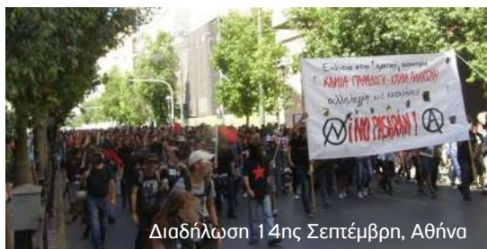
Διαδήλωση 14ης Σεπτεμβρίου, Αθήνα

άλλων «Ούτε βήμα πίσω, καμιά υποταγή, στον δρόμο να τσακίσουμε την καταστολή», «Όλοι στους δρόμους, όλοι στις πλατείες, έξω απ' τα Εξάρχεια μπάτσοι και μαφίες», «Με τους μετανάστες είμαστε μαζί, επαναπροώθηση σε μπάτσους και ναζί», «Η αλληλεγγύη το όπλο των λαών, πόλεμο στον πόλεμο των αφεντι-