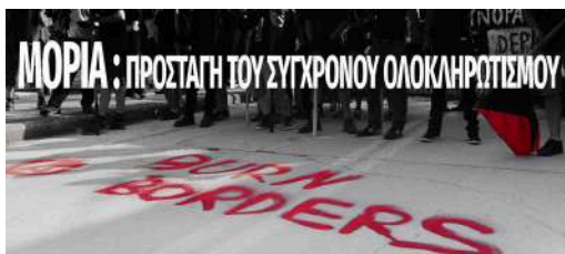
Στις 24 Σεπτέμβρη ένα 5χρονο αγοράκι πέθανε στη Μόρια, όταν ένα φορτηγό πέρασε πάνω από το χαρτόκουτο μέσα στο οποίο έπαιζε το παιδί. Στις 29 Σεπτέμβρη ξέσπασε φωτιά στο ίδιο στρατόπεδο συγκέντρωσης, από την οποία έχασε τη ζωή της μία γυναίκα, ενώ υπάρχουν και αναφορές που ενημερώνουν ότι μαζί της πέθανε και το νεογέννητο παιδί της. Άλλα επτά άτομα μεταξύ τους και παιδιά έχασαν τη ζωή τους σε ένα ακόμη ναυάγιο στα ανοιχτά του Αιγαίου και δεν πρόλαβαν να γνωρίσουν το κολαστήριο της Μόριας.