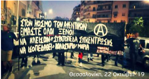
Θεσσαλονίκη, 22 Οκτώβρη '19

Στις 24 Σεπτέμβρη ένα 5χρονο αγοράκι πέθανε στη Μόρια, όταν ένα φορτηγό πέρασε πάνω από το χαρτόκουτο μέσα στο οποίο έπαιζε το παιδί. Λίγες μόνο μέρες μετά, στις 29 Σεπτέμβρη ξέσπασε φωτιά στο ίδιο στρατόπεδο συγκέντρωσης, από την οποία