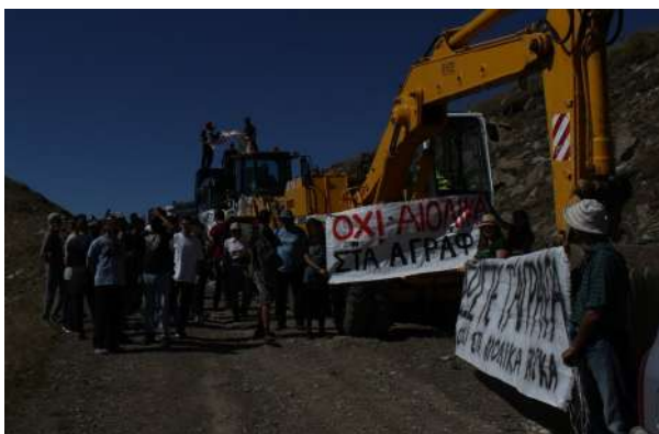
29 Σεπτεμβρίου: παρέμβαση στην περιοχή όπου έχουν τοποθετηθεί τα μηχανήματα τους οι "επενδυτές" της "ανάπτυξης" πάνω από τον οικισμό Καμάρια με κατεύθυνση προς τη Νιάλα.

«Η ανάπτυξη ήταν, είναι και θα είναι καταρχάς ένας ξεριζωμός. (...) Ανάπτυξη είναι ο οικονομικός πόλεμος (με τους νικητές του, αλλά ακόμα περισσότερο με τους ηττημένους του), η ασυγκράτητη λεηλασία της φύσης, η καταστροφή των διαφορετικών πολιτισμών».