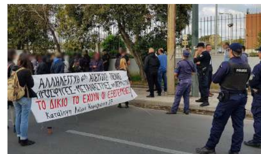
10 Νοέμβρη '19: από τη συγκέντρωση αλληλεγγύης στις κρατούμενες πρόσφυγες που πραγματοποιούν απεργία πείνας από τις 2 Νοέμβρη στα κελιά της Πέτρου Ράλλη.