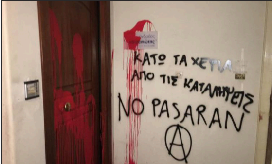
Επίθεση με μπογιές στο γραφείο του βουλευτή Αχαΐας της Νέας Δημοκρατίας Ανδρέα Κατσανιώτη, στην Πάτρα