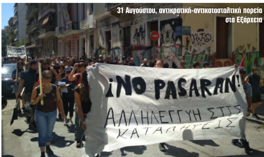
31 Αυγούστου, αντικρατική-αντικατασταλτική πορεία στα Εξάρχεια

Της επιχείρησης αυτής είχε προηγηθεί η ψήφιση αντεργατικών μέτρων, η κατάργηση του ασύλου, η ενίσχυση της ρατσιστικής νομοθεσίας απέναντι στους μετανάστες και τους πρόσφυγες, κατασταλτικές κινήσεις ενάντια σε κατειλημμένους χώρους στην Αθήνα και στα Γιάννενα. Μετά τις εκλογές, η νέα κυβέρνηση, πατώντας επάνω στα πεπραγμένα και της προηγούμενης διακυβέρνησης, ξεδίπλωσε την ατζέντα των επόμενων ετών και επι-