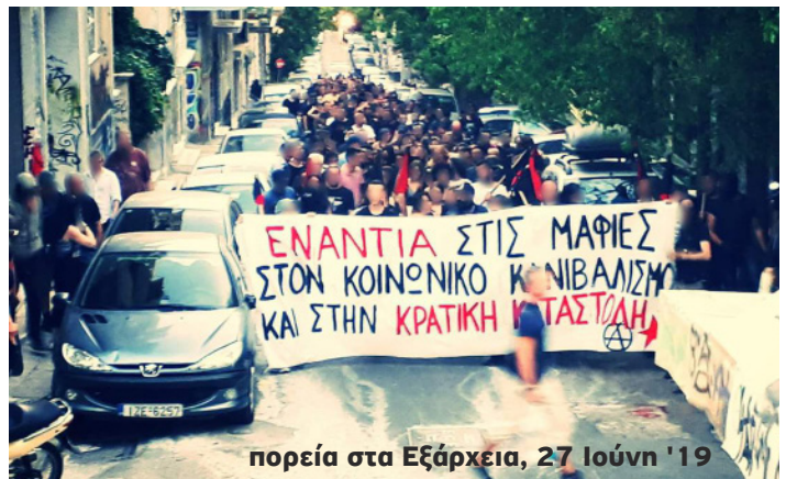
πορεία στα Εξάρχεια, 27 Ιούνη '19

ΑΛΛΗΛΕΓΓΥΗ ΣΤΙΣ ΚΑΤΑΛΗΨΕΙΣ, ΤΟΥΣ ΑΥΤΟΟΡΓΑΝΩΜΕΝΟΥΣ ΧΩΡΟΥΣ ΑΓΩΝΑ ΚΑΙ ΣΕ ΟΛΟΥΣ ΟΣΟΙ ΒΡΙΣΚΟΝΤΑΙ ΣΤΟ ΣΤΟΧΑΣΤΡΟ ΤΗΣ ΚΡΑΤΙΚΗΣ ΚΑΤΑΣΤΟΛΗΣ