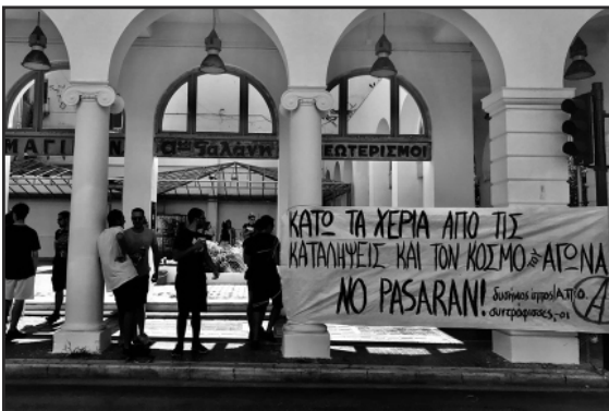
Συγκέντρωση - μικροφωνική στην Πάτρα