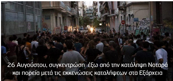
26 Αυγούστου, συγκεντρώση έξω από την κατάληψη Νοταρά και πορεία μετά τις εκκενώσεις καταλήψεων στα Εξάρχεια

Το Σάββατο 31 Αυγούστου έπειτα από κάλεσμα που απεύθυνε η συνέλευση «NO PASARAN» πραγματοποιήθηκε πορεία με τη μαζική συμμετοχή χιλίων και πλέον διαδηλωτών στους δρόμους των Εξαρχείων. Αψηφώντας την ιδεολογική τρομοκρατία και τον στρατό κατοχής των ΜΑΤ, οι αγωνιστές και οι αγωνίστριες μετέδωσαν ένα μήνυμα αντίστασης στην κρατική κατασταλτική εκστρατεία και αλληλεγγύης στους κατελιημένους χώρους αγώνα.