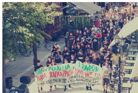
Από την πορεία που πραγματοποιήθηκε στην Καρδίτσα στις 22/8 έπειτα από τη ματαίωση της συνεδρίασης της οικονομικής επιτροπής