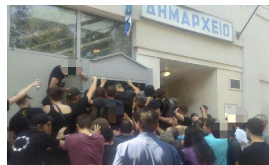
Από τη συγκέντρωση στις 5/8 στο Δημαρχείο Καρδίτσας