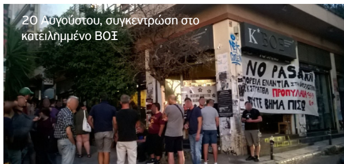
20 Αυγούστου, συγκέντρωση στο κατελιμμένο ΒΟΞ

σεται η εκκένωση των καταλήψεων – πάγια πρόθεση του κράτους ειδικά μετά την κοινωνική εξέγερση του 2008 - και η κατάργηση του πανεπιστημιακού ασύλου, αποτυπώνοντας το φόβο των κυρίαρχων για τις εστίες που έχουν λειτουργήσει στο παρελθόν και συνεχίζουν να λειτουργούν σαν σπίθα για την ανάπτυξη μιας κοινωνικής δυναμικής ικανής να σαρώσει την αλαζονεία τους. Και αν το μήνυμα που στέλνουν οι κυβερνώντες με την αποφυλάκιση του δολοφόνου μπάτσου Κορκονέα, με την ενίσχυση του νομικού τους οπλοστασίου σε βάρος των αγωνιζόμενων και με τις υπό εξέλιξη