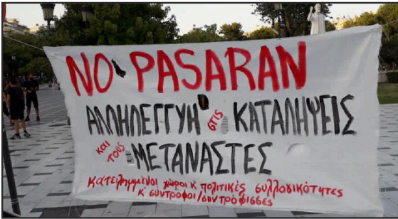
Συγκέντρωση - μικροφωνική στη Θεσσαλονίκη