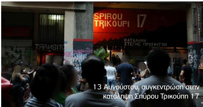
13 Αυγούστου, συγκεντρώση στην κατάληψη Σπύρου Τρικούπη 17