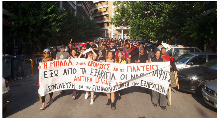
Η δεύτερη μέρα του 2ημέρου ενάντια στις ναρκομαφίες, τον κοινωνικό κανιβαλισμό και την κρατική καταστολή, με πορεία στους δρόμους των Εξαρχείων και αγώνες ποδοσφαίρου του antifa league

Σε αυτήν την κατεύθυνση στεκόμαστε αλληλέγγυοι σε κάθε αυτοοργανωμένη δομή και κάθε αγωνιστή που βρίσκεται αντιμέτωπος με την κρατική καταστολή και στηρίζουμε κάθε πρωτοβουλία που αναπτύσσεται με αγωνιστική αξιοπιστία και αξιοπρέπεια από τα κάτω απέναντι στην κρατική – καπιταλιστική βαρβαρότητα, πιστεύοντας πως όταν χτυπούν έναν από εμάς πρέπει να μας βρίσκουν όλους απέναντί τους. Συμμετέχουμε και στηρίζουμε τη συγκέντρωση και πορεία αλληλεγγύης στις καταλήψεις και τους αυτοοργανωμένους χώρους αγώνα στις 31 Αυγούστου στις 12:00 στην πλατεία Εξαρχείων, στην κατεύθυνση του χτισίματος ενός εξωστρεφούς πλατιού μετώπου αντίστασης στους σημερινούς κρατικούς σχεδιασμούς. Για την υπεράσπιση της ζωής, της αξιοπρέπειας, των αυτοοργανωμένων δομών, του ελεύθερου δημόσιου χώρου, της αγωνιστικής ιστορίας μας. Για τη διαμόρφωση των όρων της αυριανής κοινωνικής και ταξικής αντεπίθεσης.