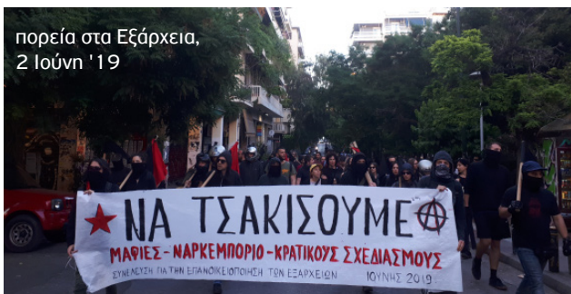
πορεία στα Εξάρχεια, 2 Ιούνη '19

Άλλωστε, κατά τις τελευταίες πολυδιαφημιζόμενες αστυνομικές επιχειρήσεις και την επίδειξη δύναμης των μπάτσων στα Εξάρχεια επιχειρήθηκε περισσότερο από κάθε άλλη φορά και επιτεύχθηκε σε έναν βαθμό η αξιοποίηση αυτής της συνθήκης. Το κατασταλτικό χτύπημα και η εκκένωση μιας σειράς προσφυγικών καταλήψεων στέγης, το ξεσπίτωμα και η προσαγωγή εκατοντάδων προσφύγων και μεταναστών, ανάμεσά τους πλήθος μικρών παιδιών, παράλληλα με επιχειρήσεις της δίωξης ναρκωτικών σε διάφορα σημεία κατά μερικών παρατρεχάμενων της μαφίας και το τσουβάλιασμα όλων μαζί