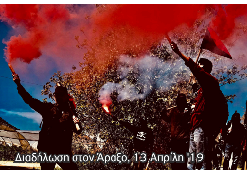
Διαδήλωση στον Άραξο, 13 Απρίλη '19