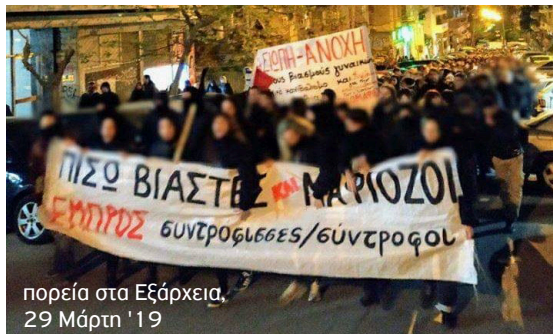
πορεία στα Εξάρχεια, 29 Μάρτη '19