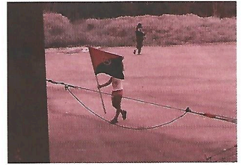
Από την παρέμβαση στο Ωραιόκαστρο