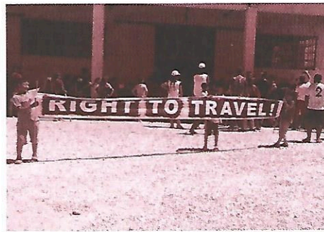
Από την παρέμβαση στα Διαβατά