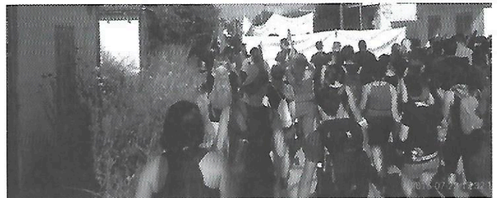
Το μπλοκ της Α.Π.Ο. από τη διαδήλωση στον φράχτη του Έβρου

Αποχωρούμε από το κτίριο της Φιλοσοφικής έχοντας μπροστά μας ανοιχτό το δρόμο για τη συνέχεια της προσπάθειας όξυνσης των κοινωνικών και ταξικών αντιστάσεων. Έχοντας