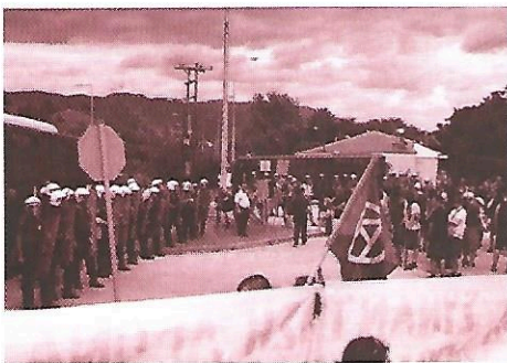
Από την πορεία στο Παρανεστί Δράμας

Αναρχική Πολιτική Οργάνωση – Ομοσπονδία Συλλογικότητων