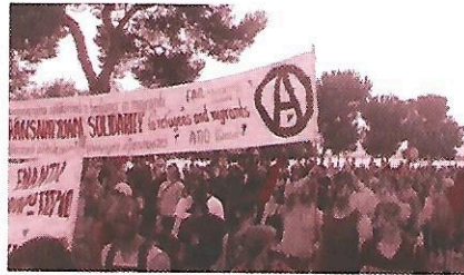
Από τη διαδήλωση στη Θεσσαλονίκη

Αναρχική Πολιτική Οργάνωση - Ομοσπονδία Συλλογικοτήτων