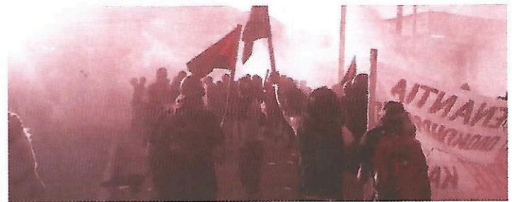
Από τις συγκρούσεις στο στρατόπεδο συγκέντρωσης στο Παρανεστί

Στα πλαίσια της ΑΣΑ παρακολουθήσαμε με μεγάλο ενδιαφέρον την εκδήλωση-παραπομπή της Αναρχικής Ομοσπονδίας