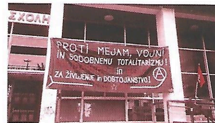
Πανό συντρόφων από Σλοβενία (FAO/IFA)