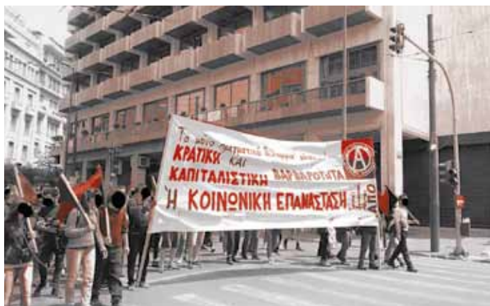
Το πανό του τοπικού συντονισμού Αθήνας, Σύνταγμα 8/5/2016

Την Κυριακή 8/5 ο τοπικός συντονισμός της Αθήνας πραγματοποίησε τη συγκέντρωση για μια Αναρχική Πρωτομαγιά στα Προπύλαια στις 11 το πρωί. Μετά από μιάμιση ώρα και αφού η ΓΣΕΕ και το ΠΑΜΕ είχαν τελειώσει τις συγκεντρώσεις τους, το πανό του τοπικού συντονισμού κινήθηκε από τη Σταδίου προς το Σύνταγμα. Τελιώνοντας την πορεία το πανό στάθηκε στη συμβολή των δρόμων Φιλελλήνων και Ερμού προκειμένου να στηριχθεί η απεργιακή συγκέντρωση και οι αποκλεισμοί που πραγματοποιούσε το Συντονιστικό ενάντια στην κατάργηση της Κυριακάτικης Αργίας και τα απελευθερωμένα ωράρια. Το απόγευμα της ίδιας μέρας και την ώρα ψήφισης του πολυνομο-