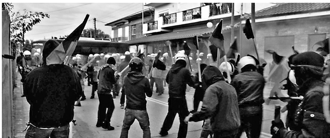
31 Οκτώβρη 2015, Καστανιές – ενάντια στον φράχτη στον Έβρο.

Τα σύνορα κλείνουν, τείχη υψώνονται και οι μετανάστες αφήνονται έρμαιο των συνθηκών της