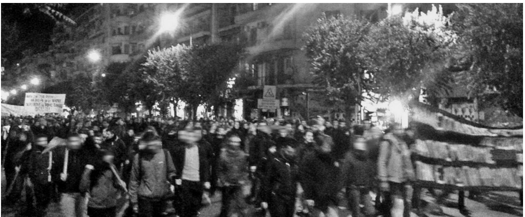
1 Δεκέμβρη 2015, Θεσσαλονίκη – πορεία αλληλεγγύης στους μετανάστες στην Ειδομένη.

Συλλογικότητα για τον κοινωνικό αναρχισμό «Μαύρο και Κόκκινο»