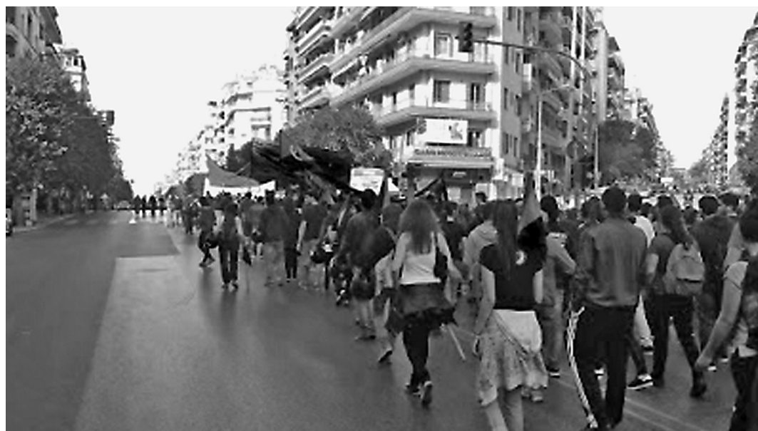
Η αναρχική διαδήλωση στη γενική απεργία της 12 Νοέμβρη στη Θεσσαλονίκη.