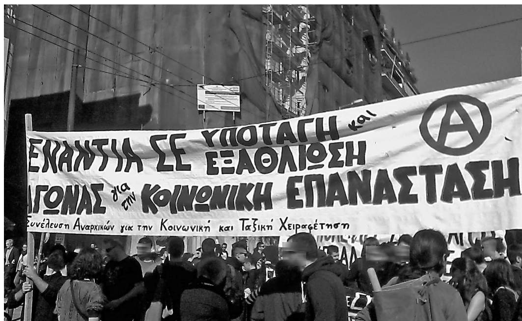
Το μπλοκ της Συνέλευσης Αναρχικών για την Κοινωνική και Ταξική Χειραφέτηση, από την απεργιακή διαδήλωση στις 12 Νοέμβρη.