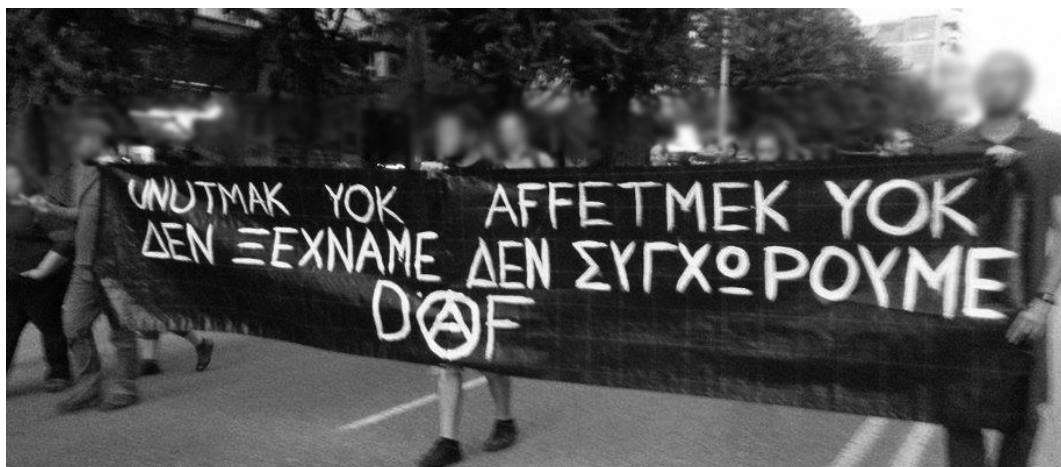
12 Οκτώβρη 2015, πανό της DAF στη διεθνιστική πορεία αλληλεγγύης στη Θεσσαλονίκη.